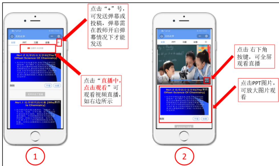
图 4 雨课堂小程序直播画面

小程序直播画面如图 4 所示；雨课堂直播中可通过弹幕、投稿与授课教师互动，授课教师可在直播中发起投票、出题等功能，请学员及时点击作答。如图 5 所示。