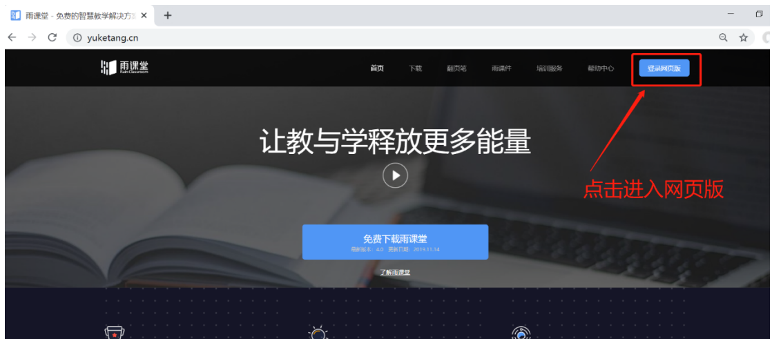
图 6 雨课堂网页版登录界面

通过浏览器进入雨课堂网页版（ https://www.yuketang.cn ），点击右上角【登录网页版】，如图 6 所示。