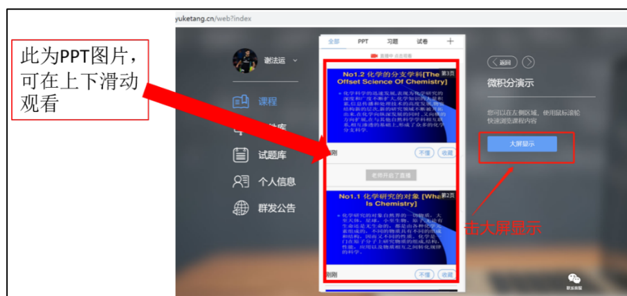
图 8 可进入大屏显示